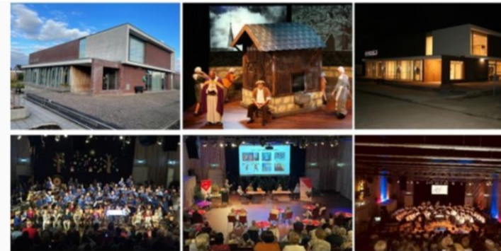
Impressie Gemeenschapshuis Oos Heim en activiteiten